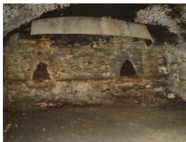
La pièce nettoyée