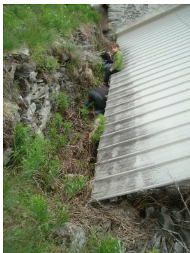
Arrière du bâtiment

Le samedi 23 mai 2015, les habitants du Roux, une dizaine, se sont réunis pour nettoyer le four du roux. Les habitants des HLM avaient vidés les quelques choses qu'ils y entreposaient ne disposant pas de cave (vélos, poussettes et autres). Nous les en remercions. Je tiens aussi à remercier les amis du Roux et les anciennes municipalités pour avoir régler les problèmes juridiques. Nous avons sorti la cuve à gasoil, le ferrailleur passera la chercher. Nous avons ensuite sorti les vieilles planches, les vieux big bag et autres déchets que nous avons porté à la déchetterie. Les restes de sel et gravier ont été évacués. Le sol a été fouillé à quelques endroits pour retrouver un dallage. Un petit morceau au fond à droite est pavé de pierres plates. Ailleurs nous n'avons pas trouvé de sol aménagé.