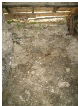
Mur arrière au dessus du grand four

Les joints entre les pierres de la voûte se désagrègent avec l'humidité. Le seuil du grand four est entrain de se détériorer fortement. L'avant du petit four est lui entrain de s'effondrer, le mur avant présente un bombement important vers l'extérieur. Quelques pierres de la voûte sont descellées et la sole est en très mauvais état. La pierre de la porte est cassée et tombée. Une réfection paraît indispensable. Les deux portes en fer forgé sont en bons états mais rouillées. Elles ne sont plus en place. Le plus gros problème de ce bâtiment est l'infiltration d'eau par le mur arrière. Une première action à mener d'urgence est la mise en place d'une gouttière et d'un drain.