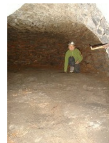
l'intérieur du grand four

Le grand four, celui de droite, est dans un état relativement correct mais très humide.