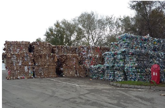
Tri et compactage des déchets recyclables pour valorisation

Pour réduire les déchets, il existe des solutions simples : privilégier les biens durables, éviter les produits emballés, acheter d'occasion, emprunter au voisin au lieu d'acheter un objet que l'on utilise rarement... Ces choix sont aussi bons pour l'environnement que pour notre porte-monnaie !