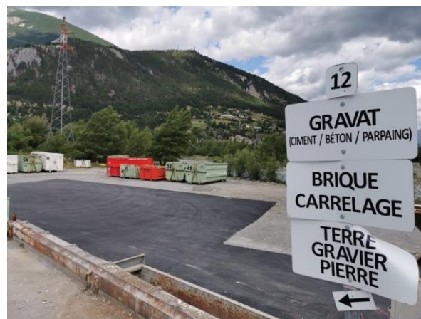
19 flux de recyclage à la déchèterie de Guillestre, ouverte à tous les habitants du territoire intercommunal

Les déchets recyclés et apportés en déchèterie sont vendus pour être valorisés , ce qui constitue une ressource financière pour la collectivité. A l'inverse, les déchets non-recyclables et les encombrants sont enfouis au centre de Ventavon, à 80 km de chez nous, avec un coût de traitement lourd qui ne cesse d'augmenter. En 2020, le coût de traitement en enfouissement des ordures ménagères résiduelles non recyclables a dépassé les 500 000 euros.