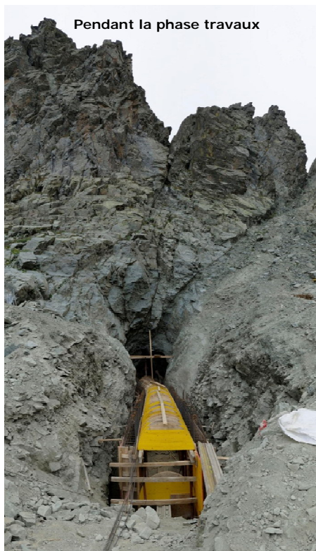
Pendant la phase travaux

Dans ce cadre, un bureau d'étude spécialisé dans le risque géologique a été missionné afin d'évaluer les impacts des travaux conjointement avec les géologues italiens. Les impacts sur le patrimoine ont été également évalués grâce