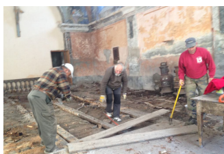
Corvée à l'Eglise de l'Echalp

La remise au gout du jour de deux corvées, a permis non seulement de réaliser d'intéressants travaux nécessaires à la valorisation de la commune, mais a permis à ceux qui ont pu y participer de retrouver une convivialité de plus en plus rare dans nos vies contemporaines : nous renouvellerons ces expériences en 2015.