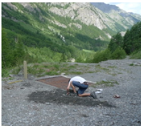
Pose des éco-compteurs

Le but de l'étude est de quantifier dans l'espace et dans le temps les flux des randonneurs, cyclistes, alpinistes et autres usagers de la réserve, tout en analysant les pratiques de ceux-ci à l'aide d'une enquête qualitative menée sur les mois de juillet et août. Ces données permettront d'adapter les actions de sensibilisation, de communication ou d'aménagement des sentiers.